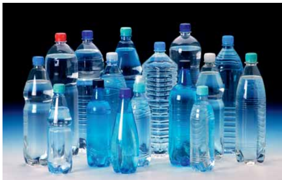
Die PET-Flasche hat sich für viele Flüssigkeiten in Haushaltsgrößen gegenüber anderen Behältern durchgesetzt, weil sie leicht ist und den Transportaufwand verringert.

Dies ist nur eines von vielen Beispielen dafür, wie Kunststoffe die Gesellschaft selbst verändert haben, indem sie Produkte und das zugehörige Nutzungsverhalten für breite Kreise der Bevölkerung erreichbar machte, die zuvor nur wenigen zugänglich waren. Es zeigt, wie engagierte Menschen mithilfe der Kunststofftechnologie weit über den direkten Produktnutzen hinaus zu positiven Veränderungen beitragen können.