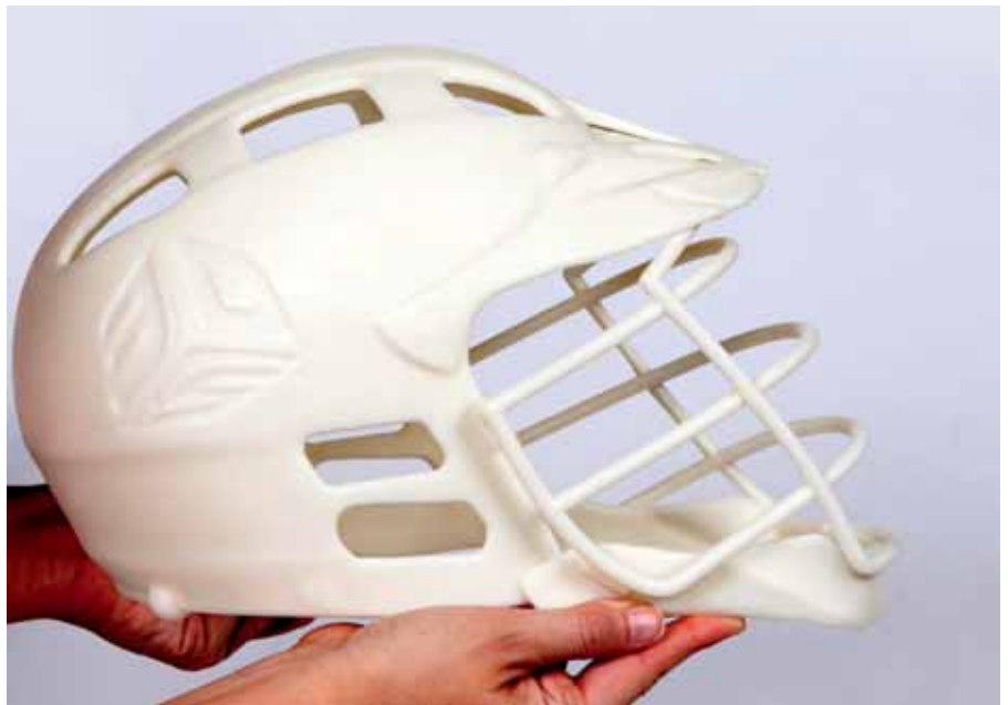
Was immer an neuen Materialien erdacht oder zufällig gefunden, entwickelt und produziert wird: Seinen Nutzwert erhält der Kunststoff dadurch, dass er in Form gebracht und zu nützlichen Produkten verarbeitet wird.

1907 behandelte der Chemiker Leo Hendrik Baekeland in einem selbst konstruierten Autoklaven eine Mischung aus Phenol und Formaldehyd mit Zusätzen von Asbest. So entstand ein bräunlicher Stoff, der sich thermisch gut in Form bringen ließ. Er war zudem mechanisch sehr belastbar, hitze- und säurefest und ein guter Isolator. Deshalb wurde das ab 1910 großtechnisch hergestellte Material zum ersten vollsynthetischen, industriell produzierten Kunststoff. Von seinem Entdecker nach sich selbst benannt, verwendete man Bakelit jahrzehntelang als führenden Gehäusewerkstoff für Elektrogeräte, vom Föhn über Telefone bis zu