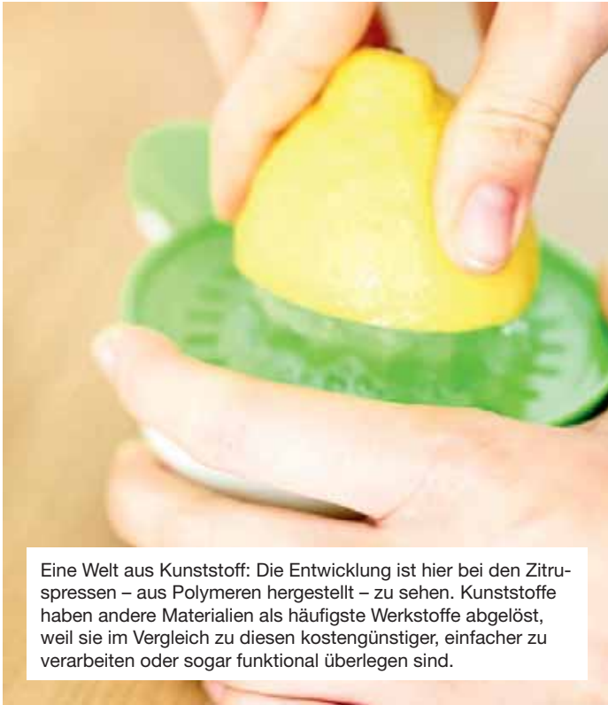
Eine Welt aus Kunststoff: Die Entwicklung ist hier bei den Zitruspressen – aus Polymeren hergestellt – zu sehen. Kunststoffe haben andere Materialien als häufigste Werkstoffe abgelöst, weil sie im Vergleich zu diesen kostengünstiger, einfacher zu verarbeiten oder sogar funktional überlegen sind.