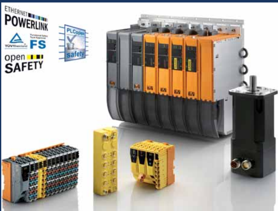
Intelligente, dezentrale und integrierte Sicherheitstechnik, die unkompliziert zu handhaben ist und dabei extrem kurze Reaktionszeiten erreicht, ermöglicht völlig neue Sicherheitskonzepte für Maschinen.

bundes im kinematischen Raum sicher zu überwachen. Auch hier wird Rechen- und Busperformance benötigt, die andere Systeme am Markt nicht bieten. Und auch hier setzen wir bei B&R auf unsere bewährten Produkte SafeLOGIC und SafeDESIGNER und das offene Sicherheitsprotokoll openSAFETY. Nun ernten wir die Früchte dafür, dass wir schon in 2004 die Weichen zugunsten einer performanten Plattform gestellt haben.