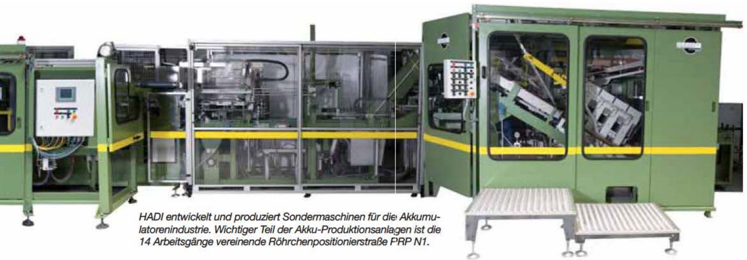
HADI entwickelt und produziert Sondermaschinen für die Akkumulatorenindustrie. Wichtiger Teil der Akku-Produktionsanlagen ist die 14 Arbeitsgänge vereinende Röhrenpositionierstraße PRP N1.

Eintaschen der Elektrodengitter folgen. Die Elektrodengitter werden anschließend mit Bleipaste gefüllt, ehe sie zu ganzen Akkumulatoren zusammengebaut, mit Stopfen versehen und gereinigt werden. War diese Fertigungskette früher ein arbeitsintensiver Prozess und die Arbeit nicht gerade gesundheitsfördernd, so herrscht heute in Akkumulatorenfabriken weltweit ein sehr hoher Automatisierungsgrad. Die Arbeit verrichten miteinander vertaktete Spezialmaschinen in Modulbauweise für die einzelnen Produkti-