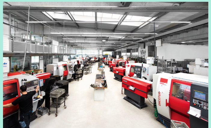
Die oft komplexen Drehteile entstehen auf über 20 CNC-Drehmaschinen in einer modernen Produktionshalle in Fulpmes. Sie werden von Partnerbetrieben gehärtet, geschliffen und oberflächenveredelt sowie im Haus nachbearbeitet, montiert, verpackt und etikettiert.