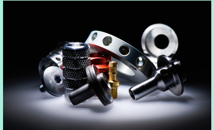
Aus Aluminium, Stahl, Messing und Kunststoff fertigt Kapferer Präzisions-Drehteile für Motorräder, Traktoren, Maschinen und Elektrogeräte.

Das Spritz-Reinigungsverfahren mit Reinigungschemie auf wässriger Basis hatte sich bewährt. Das rasche Unternehmenswachstum und die verbundenen steigenden Stückzahlen machten jedoch 2003 die Anschaffung einer Anlage mit höherer Kapazität erforderlich. „Wegen der hervorragenden Erfahrungen mit der Beratung und Betreuung durch MAP PAMMINGER wendeten wir uns wieder an die Experten aus Gmunden“, berichtet Peter Huter.