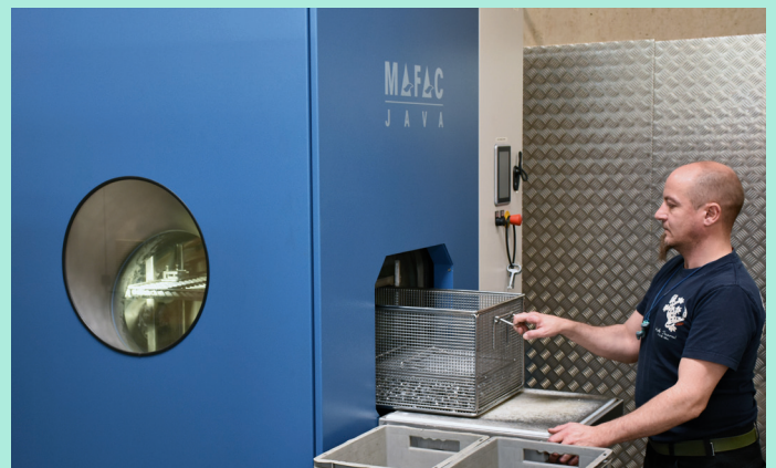
Die Reinigung der aus unterschiedlichen Materialien gefertigten Drehteile erfolgt im Spritzflut-Reinigungsverfahren in einer Zweibad-Anlage MAFAC JAVA.