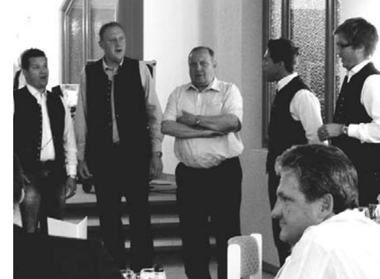
Der Jauntaler Viergesang singt beim Abschlussabend am Sonntag, 11. Mai 2008 im Hotel Sonne.